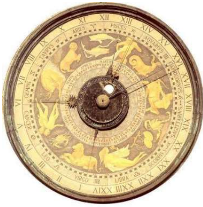
ORDINE degli INGEGNERI della PROVINCIA di CREMONA Via Palestro, 66 - Cremona